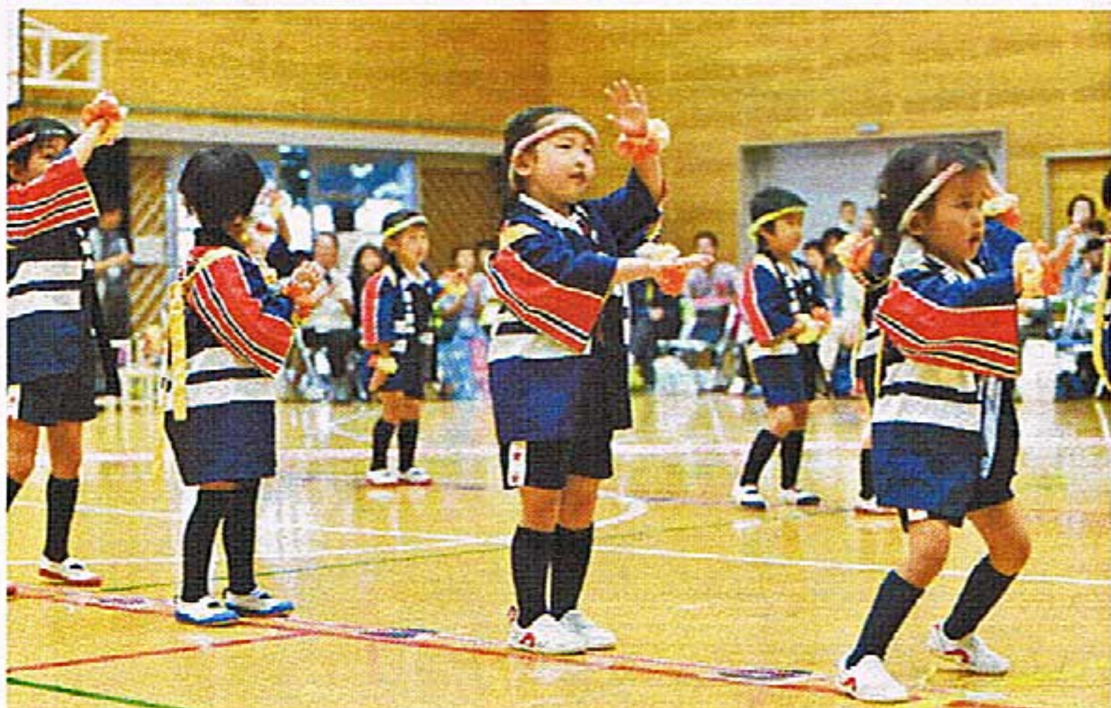
年中児 遊戯【よさこい ソーラン】