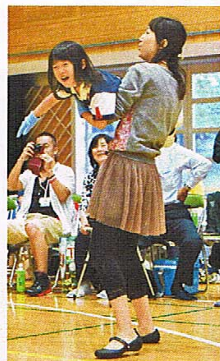
年少児 遊戯 アナと雪の女王 【親子で Let it go】