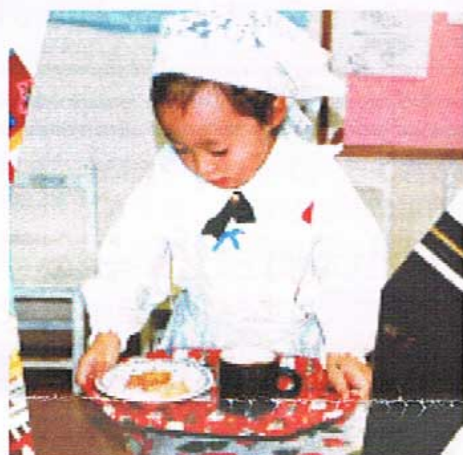
ティールーム (お客様にお茶のおもてなし)

子どもたちの真剣な姿に、大人の驚きのまなざしで、 子ども達は、いっそうすばらしく輝きます。