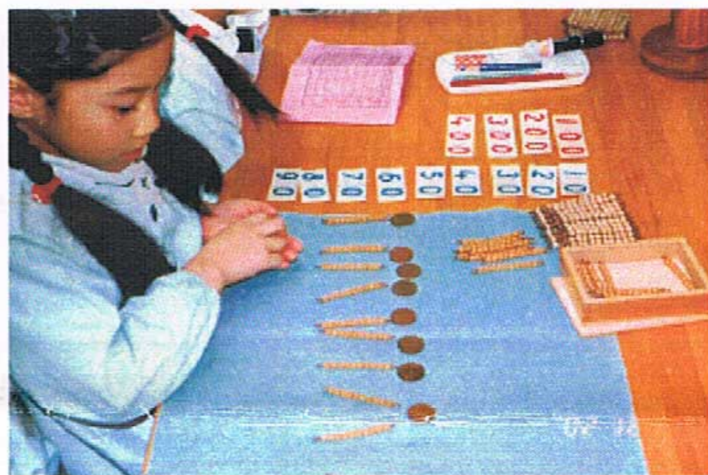
くるみぎんこう (10円玉とピースの対応)

2日間にわたって、くりひろげられる保育現場の公開！ ぜひともご覧になってください。