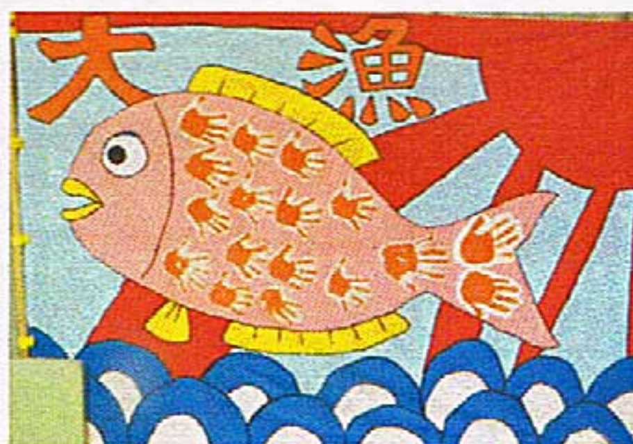
年中児のみんなで 作り上げた 【大漁旗】