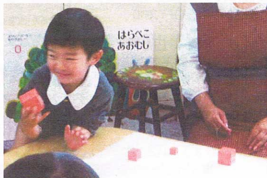
感覚教具(ピンクタワー) 視覚(鋭い観察力)