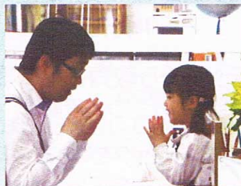
~お父様とご一緒に柏餅をいただきました~

お父様・お母様、お子様との関わりが幼稚園で過ごされている様子です。 お子様方も自然と笑みがこぼれ、親子の時間を大切に過ごされています。 2学期に向けて園行事も、増えて参りますので、お子様方は、幼稚園で困難性のあることにも挑戦し、達成してご成長をされていくのを感じます。 ご家庭にて過ごされる時間に沢山 スキンシップをとっていただきお子様方の 活力となります様、お見守り頂きたい と思います。 2学期からもどうぞ宜しくお願い致します。