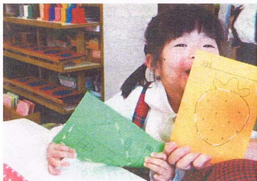
日常生活の練習(ぬいさし) 目と手の協応性の発達

日々の幼稚園生活を、おじい様・おばあ様にご覧いただき、ご案内申し上げます。 ご都合のよろしい日程をお選びになって、どうぞ、ご来園ください。 お待ち申し上げます。