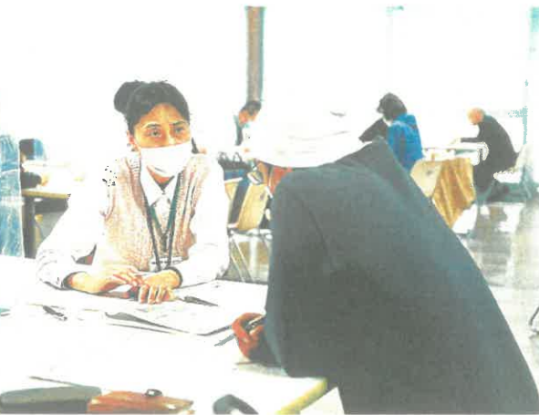
訪れた人たちが熱心に話を聞いていた。24日午後、大阪市中央区