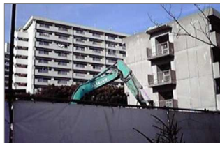
←医療センター内の 私立認可保育園建設地