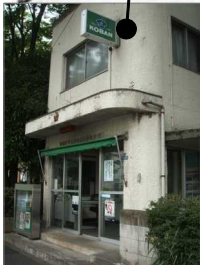
←戸山町交番 <管轄区域> ・戸山2丁目1番～35番 ・戸山3丁目1番～20番

牛込警察管内11ヶ所の交番のうち3ヶ所もなぜ廃止しなければならないのでしょうか？