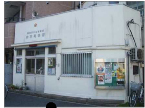
←弁天町交番 <管轄区域> ・弁天町1番～178番 ・南榎町1番～78番

建物が残っても、『交番』という看板や赤色灯が外されては、「抑止力」にもなりません。引き続き「交番として存続を」の声を上げていきましょう。