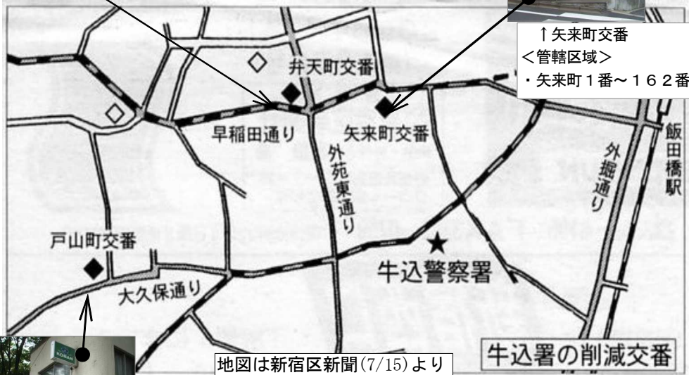
地図は新宿区新聞(7/15)より