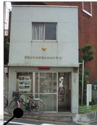
↑矢来町交番 <管轄区域> ・矢来町1番～162番