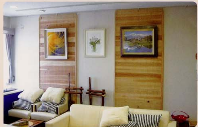
児童養護施設の壁