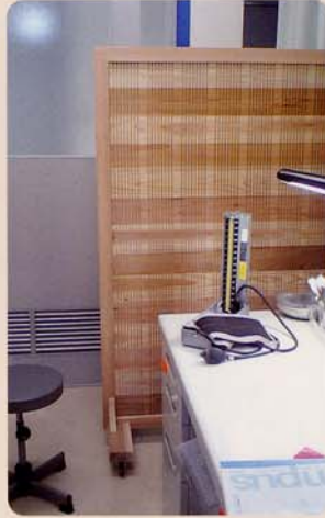
医院のパーテーション