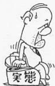
実態にフタをしないでお

なお、協議会が何をしているのかについては明確な回答がなく、今後の方針を述べたのみでした。つまり『山師の玄関』だったようです。