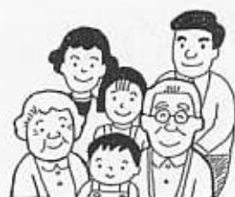
こんな笑顔の町に

◇千葉県共同募金会の実施要項によると「新たな年を迎える時期に、支援を必要とする人達が地域で安心して暮らせるよう、様々な福祉活動を重点的に展開するもの」と規定しているので問題はない。今後は誤解を招かないよう丁寧に細かな説明をしていく。