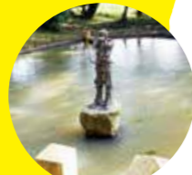
日本武尊ゆかりの井戸