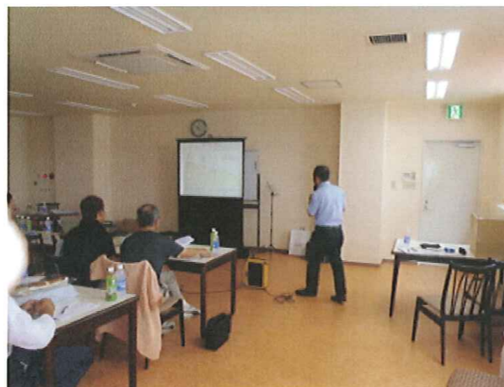
京丹波吹奏楽団（なみすい）