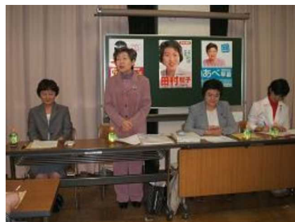
10月22日、戸山社会教育会館で近藤区議・あべ区議共催で行なわれた「区政報告会」。あいさつに来た右から大山都議とすえよし和さん。

大山都議からは、オリンピック問題など都議会の様子などを報告。すえよし和さんからは、今区内で子どもたちやお年寄りが苦しんでいる実態が紹介され、こ